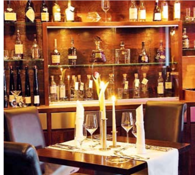
Die Lage im Herzen der Ferienregion Ammergauer Alpen ist einer von mehreren Trümpfen des Designhotels mit Wohlgefühlcharakter.