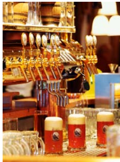
Im Ammergauer Maxbräu genießt man hausgebraute Bierspezialitäten und Klassiker aus der bayerischen Küche.